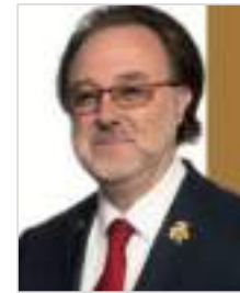
BEST SOMMELIER OF THE WORLD PHILIPPE FAURE-BRAC