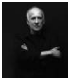
ARQUITECTO CARRILHO DA GRAÇA