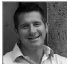
FRANCIS FORD COPPOLA WINERY COREY BECK